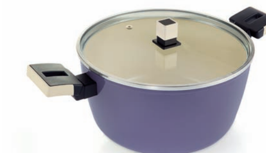
Casseruola 2 maniglie con coperchio in vetro Dutch oven with glass lid