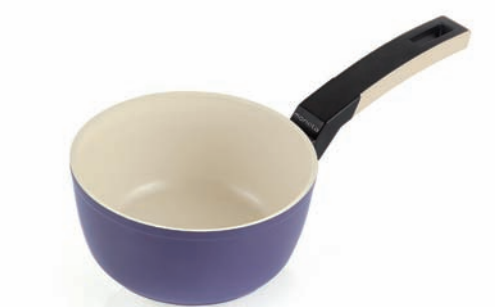
Casseruola 1 manico Saucepan