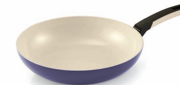
Wok / Wok (1 handle)