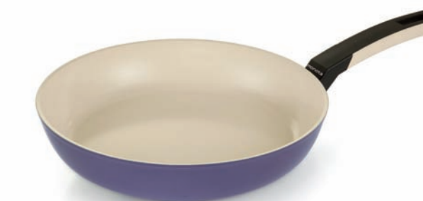
Padella / Frypan

Once it reaches 140°C, the EnergySaver logo appears on the special thermochromic ring on the handle. All you need to do is turn down the heat to avoid burning - slashing energy consumption and preventing the loss of liquids that are rich in nutrients.