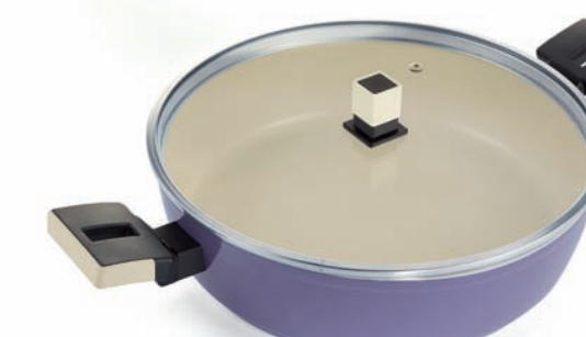
Tegame 2 maniglie con coperchio in vetro 2 handle skillet with glass lid