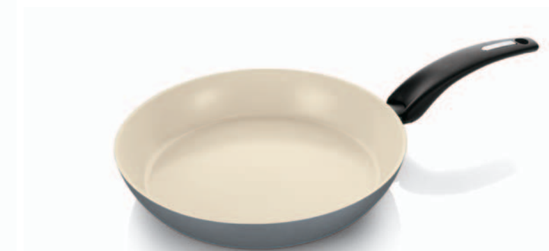
Padella / Frypan