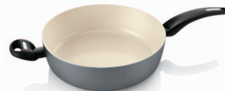
Tegame 1 manico 1 maniglia con coperchio di vetro Sauté pan, 1 hand-grip and glass lid