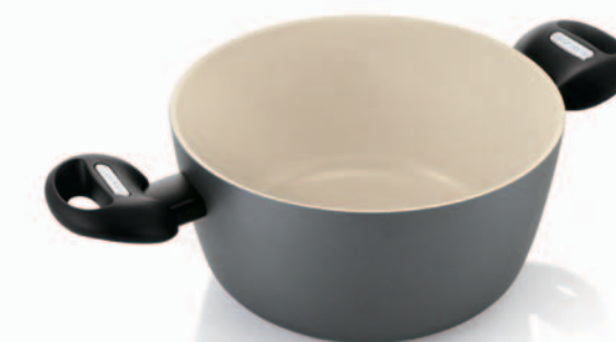
Casseruola 2 maniglie con coperchio di vetro Dutch oven with glass lid