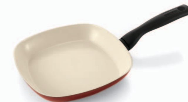
Padella / Frypan