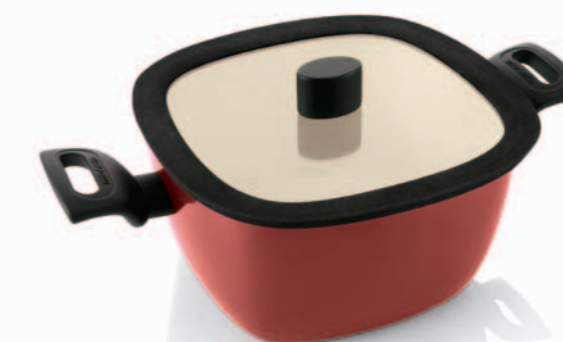
Casseruola 2 maniglie con coperchio di vetro Dutch oven with glass lid